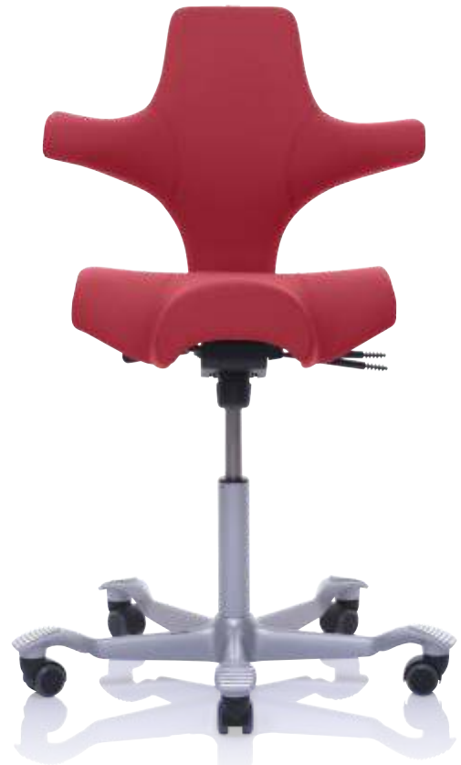
Design: Peter Opsvik. Patent- und Designgeschützt.